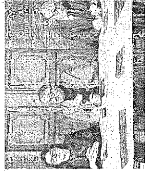
La conferenza stampa